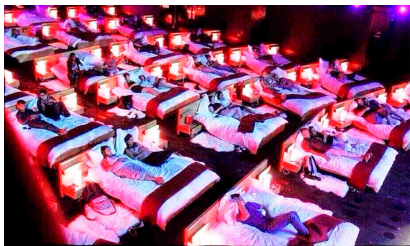
Cines El dormilón

PON NOMBRE A ESTOS CINES TAN CHULIS. ¡EL QUE TÚ QUIERAS!